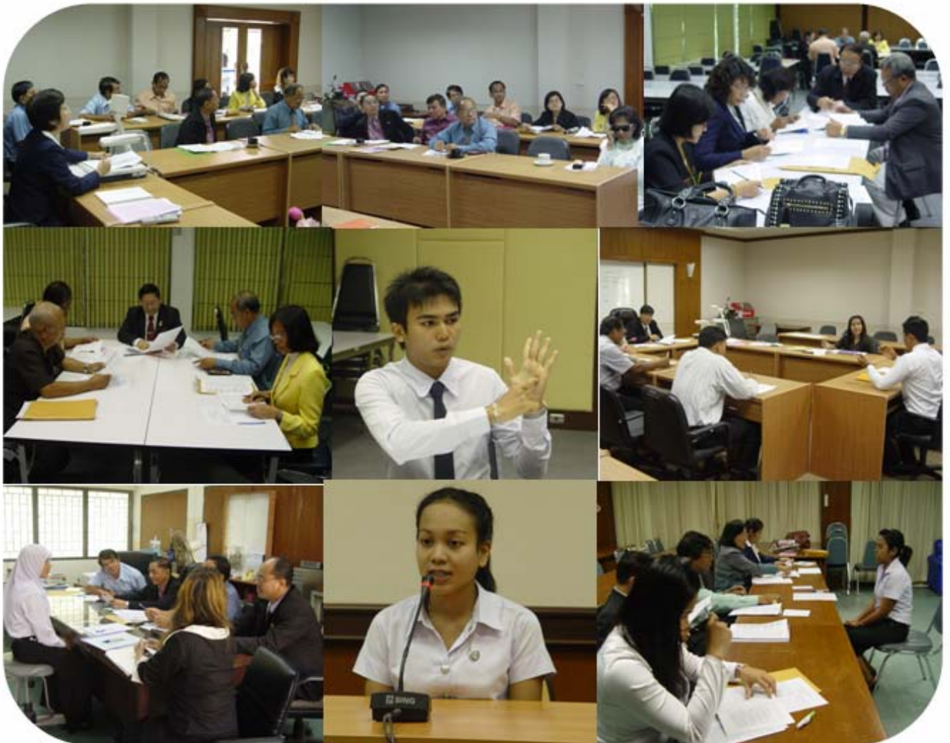
บรรยากาศในการสัมมนา

โดยมีคณบดีคณะครุศาสตร์ และรองคณบดีฝ่ายวิชาการ ให้การต้อนรับและคอยดูแลอำนวยความสะดวกคณะกรรมการสัมมนา